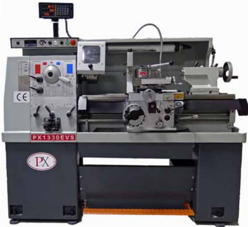
Abbildung inkl. optionaler 3-Achs Digitalanzeige.